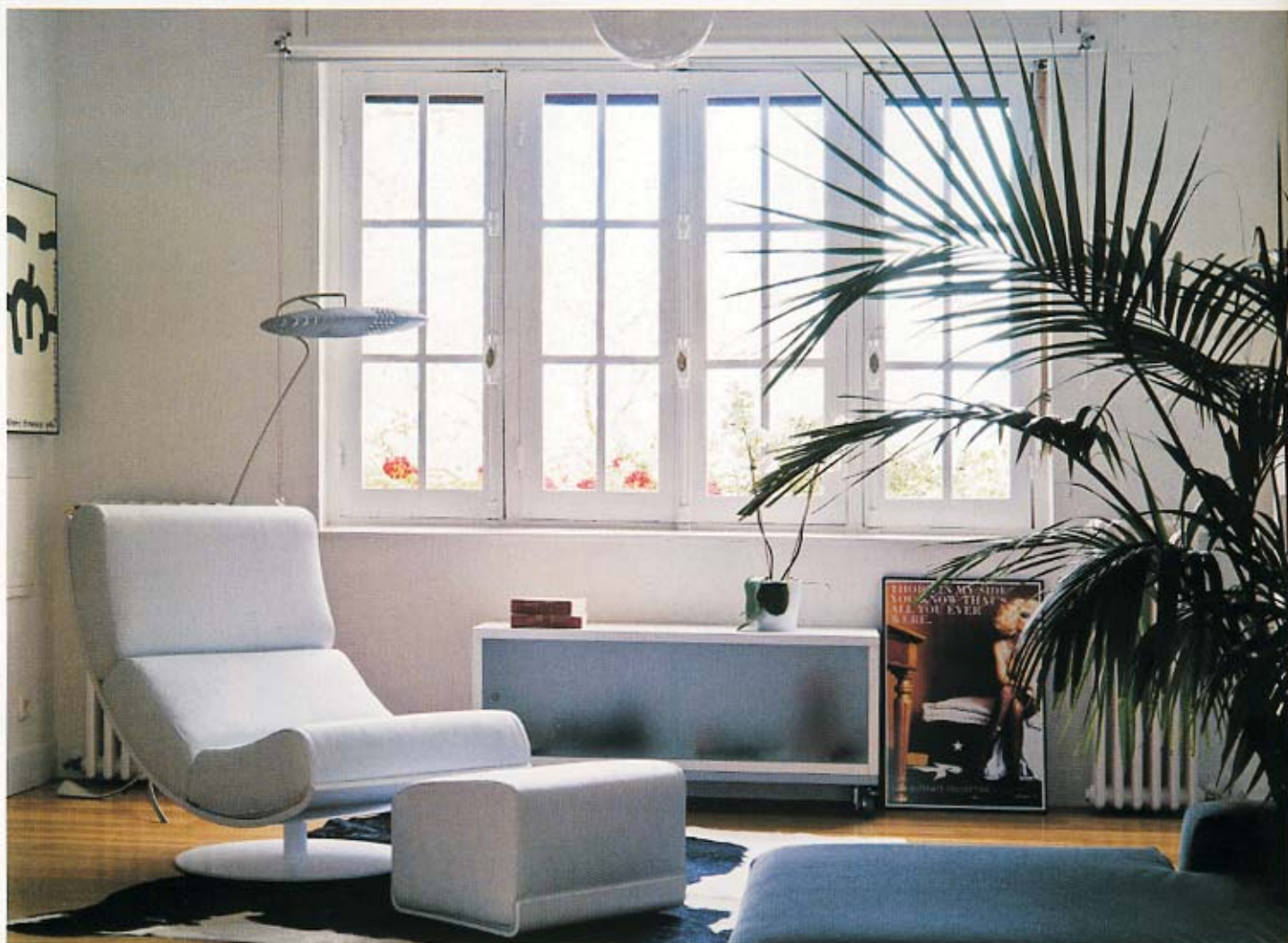
UN RINCÓN DE LECTURA, con la butaca Art, del estudio Arquea para Sancal. La lámpara Titania es de Luceplan. EN EL SALÓN, un sofá antiguo retapizado y la mesa Elipse, de Sancal, sobre la alfombra Woodnotes de Ritva Puotila. La lámpara de pie es la TMM de Santa & Cole. La de techo, la Caboche de Foscarini.